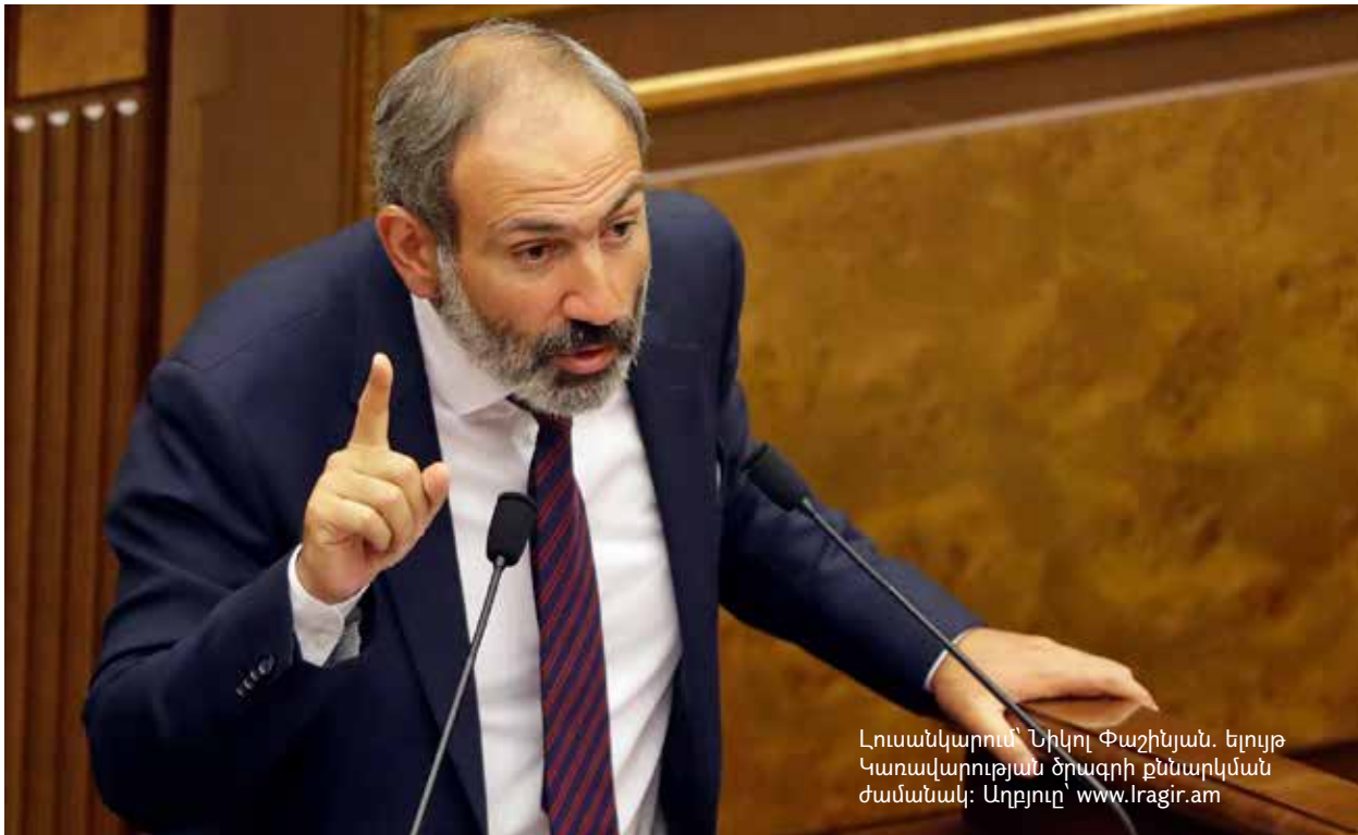
Լուսանկարում՝ Նիկոլ Փաշինյան, Ելույթ Կառավարության ծրագրի քննարկման ժամանակ: