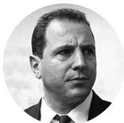
Դավիթ Տոնոյան ՀՀ պաշտպանության նախարար

Նրա խոսքով, կրթության ոլորտի 2020-2030 թվականների հայեցակարգի ծրագրի քննարկումից հետո դրան կանդրադառնան: