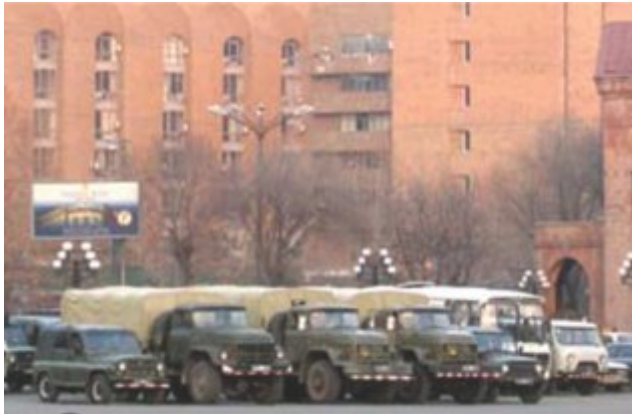
Բանակի ներգրավումն ու մասնակցությունը հետընտրական գործընթացներին եվ մարտի 1-2-ի իրադարձություններին

Սակայն, ներքևում շարադրվող օրինակները, հավանաբար, հնարավորություն կտան պատկերացնելու, թե որքան է այժմ սերտաճած ՀՀ ՁՈՒ-ն քաղաքական կամ, շատ դեպքերում, քաղաքացիական գործընթացների հետ: