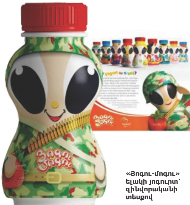
«Յոգու-մոգու» ելակի յոգուրտ՝ զինվորականի տեսքով

Ըստ էության, զինվորական համազգեստը գրեթե որևէ կերպ չի կապվում պատերազմի կամ մահվան հետ, այլ, ավելի շուտ, հերոսության, հայրենասիրության կամ քաջության խորհրդանիշի է վերածվել: