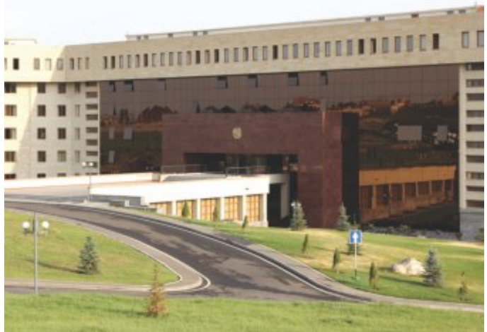
ՀՀ Պաշտպանության Նախարարության Նորակառույց շենքը

«Որևէ տրամ չկա: Կա այլ երկրների փորձ: Կա նաև միջազգային ճնշում՝ ՀՆԱ 4%-ից ոչ ավել: Բյուջեի կառուցվածքը որոշում է կառավարությունը: Սրան, բնականաբար, միջամտում է երկրի բարձրագույն ղեկավարությունը: Երբեմն վերլուծություններ են անում, թե այս կամ այն ոլորտի ծախսը ինչպե՞ս կազդի ՀՆԱ-ի վրա: Սա ամենապրոֆեսիոնալ մոտեցումն է: Կոնկրետ այսօրվա կառավարության նման վերլուծություններից տեղյակ չեմ», - ասաց նա: