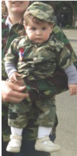
Հայրենիքի ապագա պաշտպան