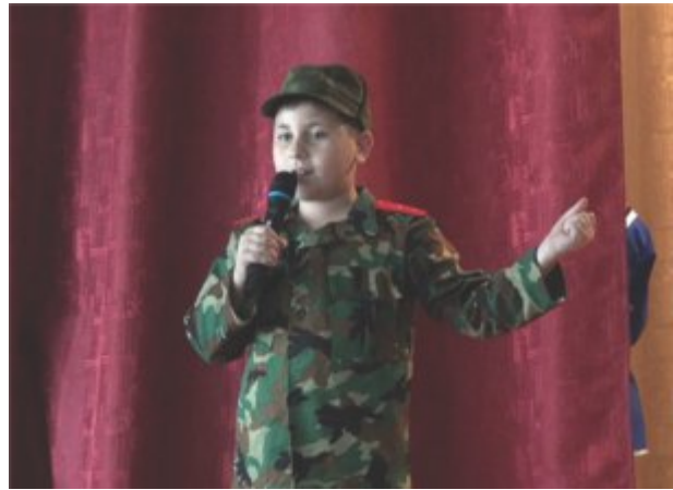
«Իսկական տղամարդ» հանդիսացող հայրենասեր զինվորի կերպարն ամենուրեք է՝ հեռուստացույցում, գովազդային պաստառներում, խաղալիքներում, խաղերում, դպրոցական դասագրքերում և տանը:

«...Ադրբեջանում հայերի նկատմամբ ատելությունն օրեցօր ավելի ու ավելի է ուժգնանում: Ի՞նչ է, մենք պետք է սե՞ր քարոզենք», - կասեն շատերը: