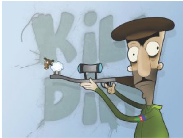
«Քիլ Դիմ» մուլտ-նախագիծ