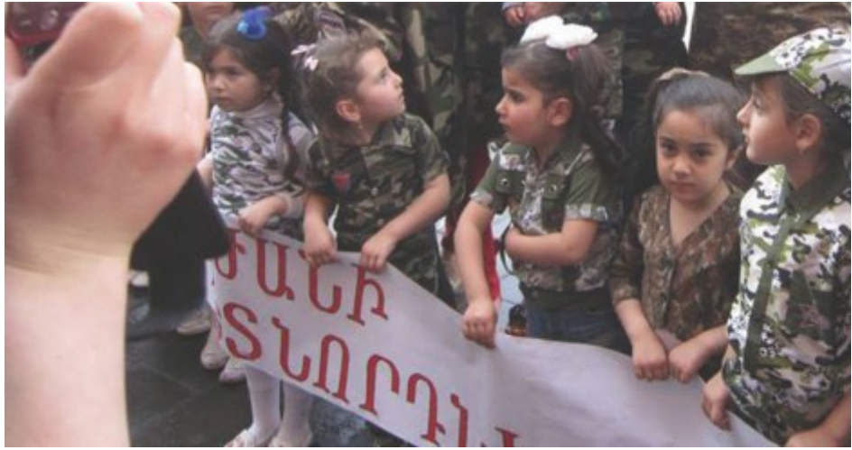
Աղջիկներն, ասես, ետ չեն ուզում մնալ տղաներից իրենց «հայրենասիրությամբ»

Կարգուկանոնի և սպայական անձնակազմի վերահսկողության բացակայության պայմաններում, ցանկացած ոք, ով չի համապատասխանում կուլտիվացվող և ակտիվորեն քարոզվող անվախ, համարձակ, միշտ ճշտապահ տղամարդու կերպարին, այս ոչ-ֆորմալ հարաբերություններում ստիպված է լինում ստանձնելու «կանացի» դերեր, որոնք հիմք են հանդիսանում հոգեբանական հողի վրա ինքնասպանությունների, բռնությունների և սպանությունների համար: