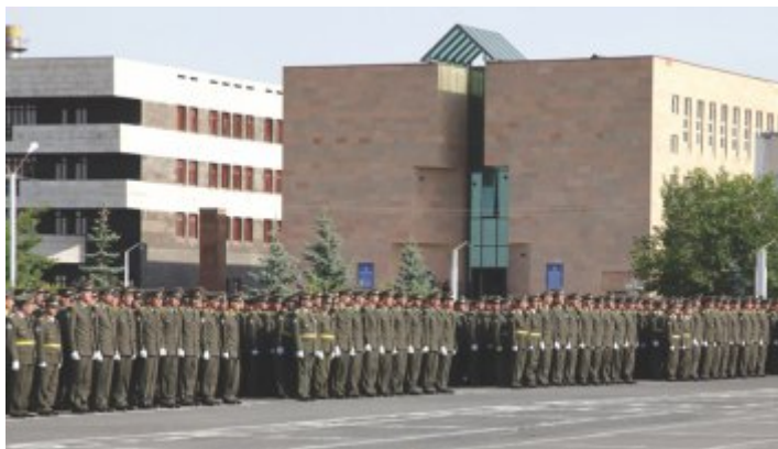
Վազգեն Սարգսյանի անվան ռազմական ինստիտուտ

Մեծ չափերի հասնող գործազրկության պայմաններում, պաշտպանական ոլորտը եզակիներից է, որ աշխատանքի հնարավորություն է տալիս Հայաստանի՝ հատկապես արական սեռի բնակչությանը: Վերջին 5-6 տարիների ընթացքում կտրուկ աճել է ռազմական բուհերի դիմորդների թիվը 18 , քանի որ, հենց իրենց՝ դիմորդների հավաստմամբ, այս բուհերում սովորելը գրեթե երաշխիք է վաղը բավականին բարձր վարձատրվող, կայուն աշխատանք ունենալու համար, ինչի կարիքն այդքան ունեն ծանր կացության մեջ հայտնված հայ ընտանիքները: Հաշվի առնելով հայաստանյան հասարակության գենդերային կառուցվածքն ու գենդերային դերերի նկատմամբ եղած ընկալումները 19 ՝ հենց տղամարդկանց ուսերին է դրված թե՛ ընտանիքների անդամների ապահովված լինելու, թե՛ նրանց անվտանգության մասին հոգ տանելու խնդիրները: Ուստի, պարզեցնելով օրինակը, ստացվում է, որ հենց իրենց՝ տղամարդկանց շահերից է բխում պաշտպանական ոլորտում նորանոր աշխատատեղերի ստեղծումը: