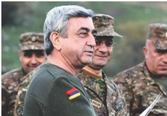
Սերժ Սարգսյան. «Եթե մեզ պարտադրեն, մեր հարվածը կլինի կործանարար և վերջինը»

Ըստ ելույթի, ՀՀ-ն ղեկավարվում է Ղարաբաղյան պատերազմի մասնակից, զինվորական մի մարդու կողմից, որը մինևույն ժամանակ հանդիսանում է իշխող «Հանրապետական» կուսակցության նախագահը: Նա նաև ՀՀ շախմատի ֆեդերացիայի նախագահն է, ինչը, սակայն, քիչ կապ ունի վերլուծության հիմնախնդրի հետ: