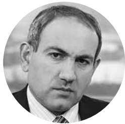
Նիկոլ Փաշինյան, «Ելք» դաշինքի ղեկավար

Հարցման արդյունքում ստացված միակ պատասխանը՝ «զինծառայության» օրենքին դեմ քվեարկած միակ խմբակցության՝ «Ելք»-ի ղեկավար Նիկոլ Փաշինյանից, առանց խմբագրման ներկայացնում ենք ստորև: