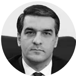
Արման Թաթոյան, ՀՀ մարդու իրավունքների պաշտպան

ԶՈՒ-ում մահվան ելքով միջադեպերի կանխարգելման, դրանց թվի կրճատման վերաբերյալ հայեցակարգի առաջարկած մեխանիզմներին ո՛չ «Ելք»-ի, ո՛չ ՊՆ-ի պաշտոնական գրություններում, ըստ էության, չկա որեւէ անդրադարձ: Փոխարենը Գ. Հայրապետյանը նշում է, որ գերատեսչության ղեկավարներն ու հրամանատարական կազմը հետետողականորեն աշխատանքներ են իրականացնում այդ ուղղությամբ եւ մեջբերում, որ ԶՈՒ-ում մահվան դեպքերի նվազում ունենք: