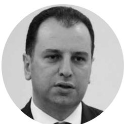
Վիգեն Սարգսյան, ՀՀ պաշտպանության նախարար

Վերլուծելով կազմակերպության հարցմանը ՊՆ պատասխանն ու համադրելով այն «Ելք» խմբակցության արձագանքի, նաև մինչ այժմ հայեցակարգի ընդդիմախոսների բարձրաձայնած մտահոգությունների եւ ԽԵ աշխատակազմի սեփական դիտարկումների ու ուսումնասիրությունների հետ՝ կարելի է մեկ անգամ ես արձանագրել, որ «Ազգ-բանակ» հայեցակարգը մշակողների ու իրականացնողների համար գուցե առաջնային են եղել, մասնավորապես, բանակը համալրելու, պաշտպանության, արտաքին անվտանգության խնդիրները, սակայն բնավ կարելի չեն այնպիսի հիմնախնդիրների լուծումը, ինչպիսիք են զինված ուժերում մարդու իրավունքների վիճակի բարելավումը, սոցիալական անարդարության վերացումը, պայքարը կոռուպցիայի դեմ, քաղհասարակության վերահսկողությունն ուժեղացնելը եւ այլն: